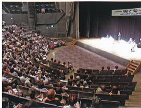
2012年 シンポジウム「男と女」上野千鶴子氏講演