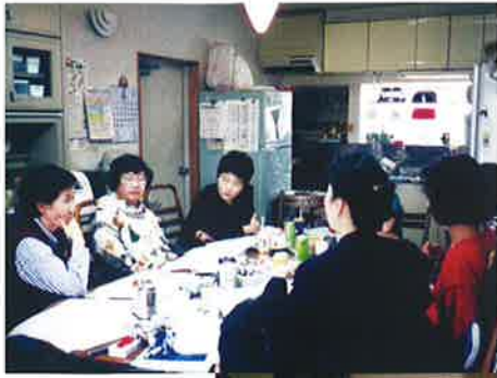
1998年 高齢者バリアフリー 研究会