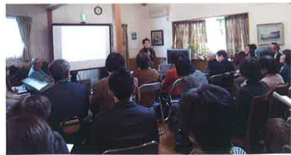
2013年 横浜ワークショップ「地域に開くグループリビング」 1日目 COCO湘南台座談会