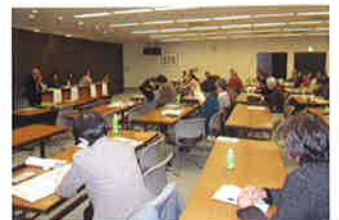
横浜ワークショップ 2日目 神奈川県民ホール 大会議室