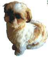
2012年 ココちゃんがやってきた