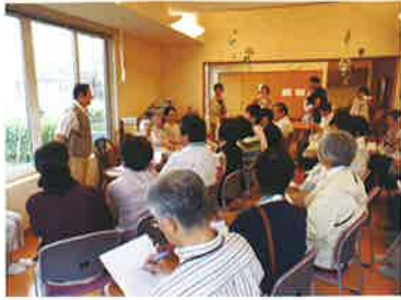
2011年 登別ワークショップ